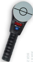
ASR A 1.7 BGR 232